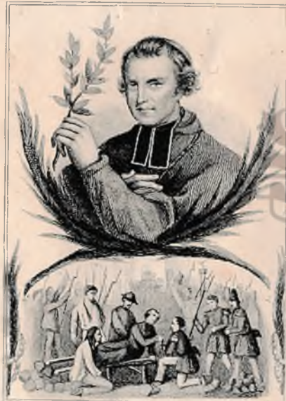
M. DENIS AUG. AFFRE. Archevêque de Paris. Mort le 27 Juin 1848.

DE L'IMMORTEL P. J. BÉRANGER POÈTE INIMITABLE, ET DIGNE REPRÉSENTANT DU PEUPLE DE LA TEMPÉRÉE ET FRATERNELLE RÉPUBLIQUE FRANÇAISE.