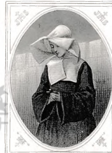
LA CHARITÉ DE JESUS-CHRIST ME PRESSE.

Ah! daigner, bonne Providence, Daignez bénir nos bienfaiteurs, Et qu'ils trouvent leur récompense Dans le trésor de vos faveurs.