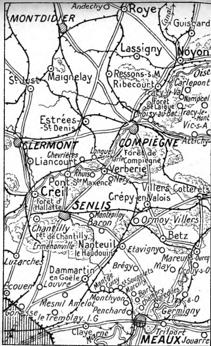
I. — CARTE POUR SUIVRE " LA MARCHÉ DE L'AILE DROITE ALLEMANDE SUR PARIS "