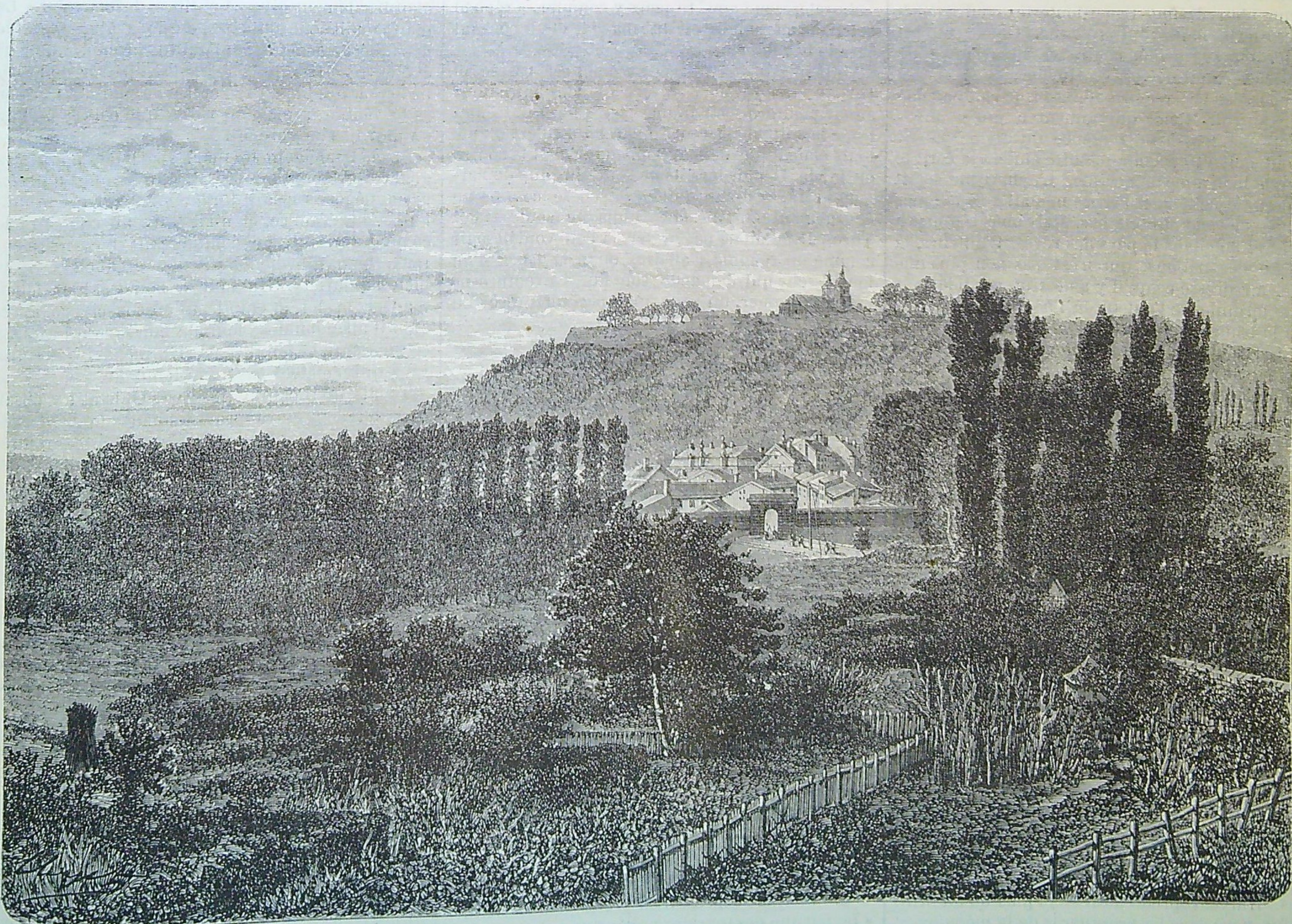
VUE DE MONTMÉDY. — Gravures extraites des Ardennes illustrées , ouvrage publié par M. de Montagnac. — (L. Hachette et Co, éditeurs.)

Quand je dis que Pierrefonds résista à tous les assauts, j'entends aux assauts d'estoc et de taille, qui se livrent