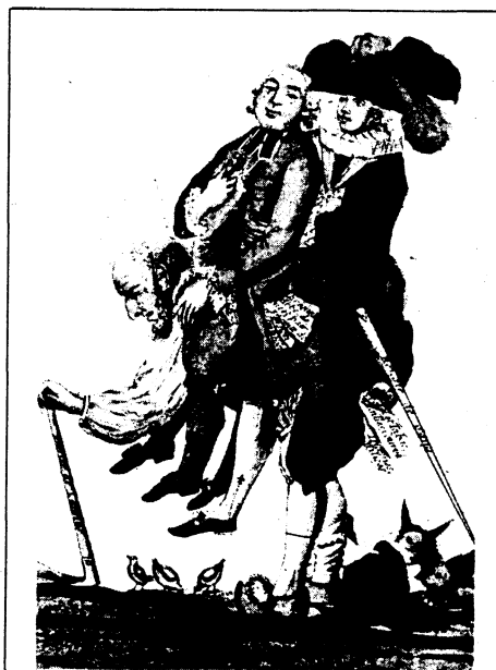
Un paysan portant un prélat et un noble.