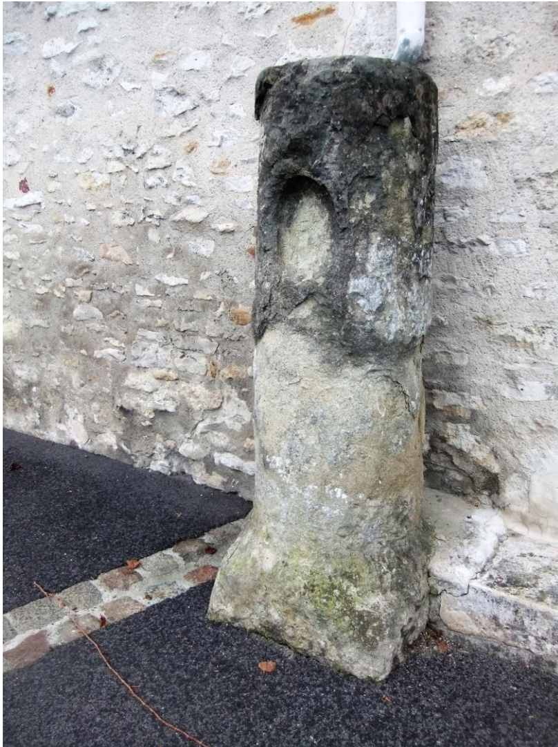
@ Gilles Bodin

Où se trouve cette borne et de quand peut-elle dater ?