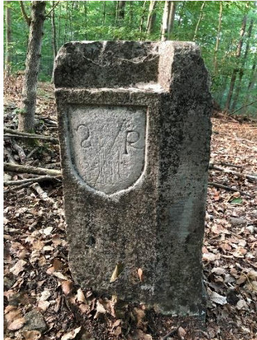
Chapitre de Saint-Rieul