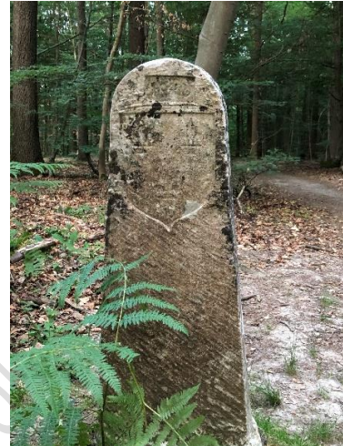
Roi de France

Le chapitre de Saint-Rieul de Senlis suit l'exemple du connétable. Il possède trois parcelles de bois en forêt d'Halatte et a déjà eu un conflit avec le prieuré Saint-Maurice de Senlis à propos de son bois du Tombray. Il possède deux parcelles au-dessus d'Aumont qui, chacune, est limitrophe d'un des bois du connétable. Il va donc profiter du travail commencé par Anne de Montmorency pour finir de limiter par 13 bornes armoriées la plus grande de ces deux parcelles qui jouxte le bois de la Livrée et qui sera nommé par la suite le bois de la Borne-Morel.