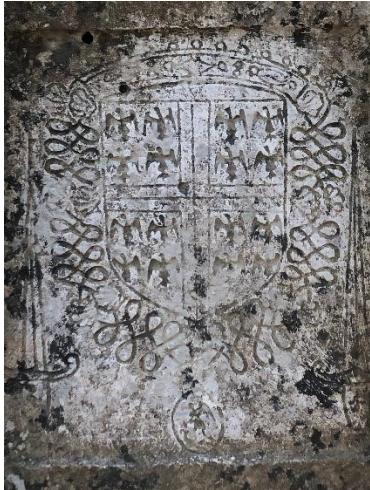
Connétable de Montmorency

Dans la forêt d'Halatte, au mont Alta, le connétable possède deux bois entourés par des propriétés particulières et touchant aux bois du roi. Il s'agit du bois de la Livrée et du bois de Fosses qui sont entrés dans son domaine par héritage en 1496. Les bornes - 17 pour le bois de la Livrée, 30 pour le bois de Fosses - sont plantées au mois de novembre 1540.