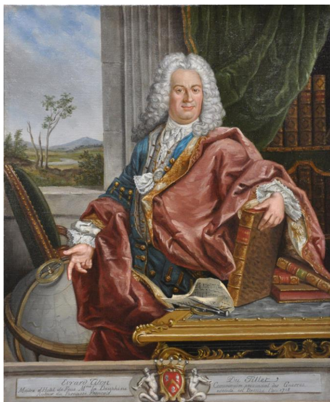
© Boldoni - Musée de Senlis