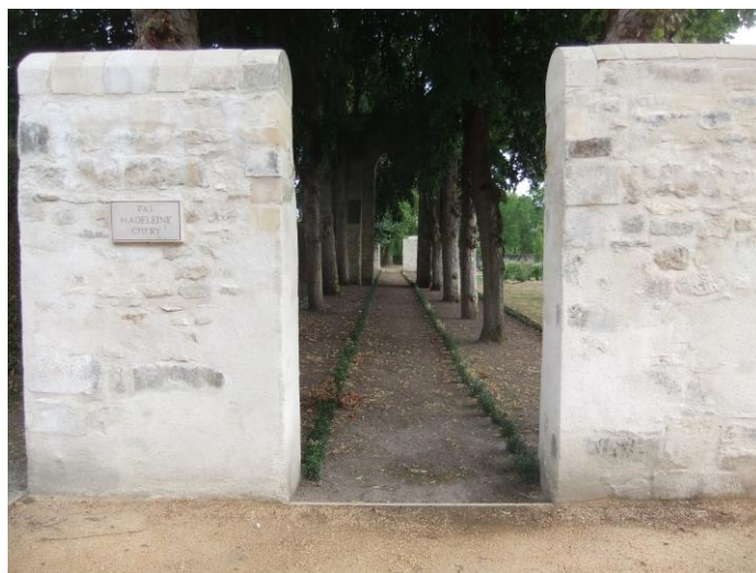
Jeu d'arc du bastion de la Porte de Meaux