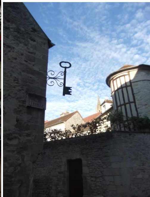
Ancien et nouvel emplacements