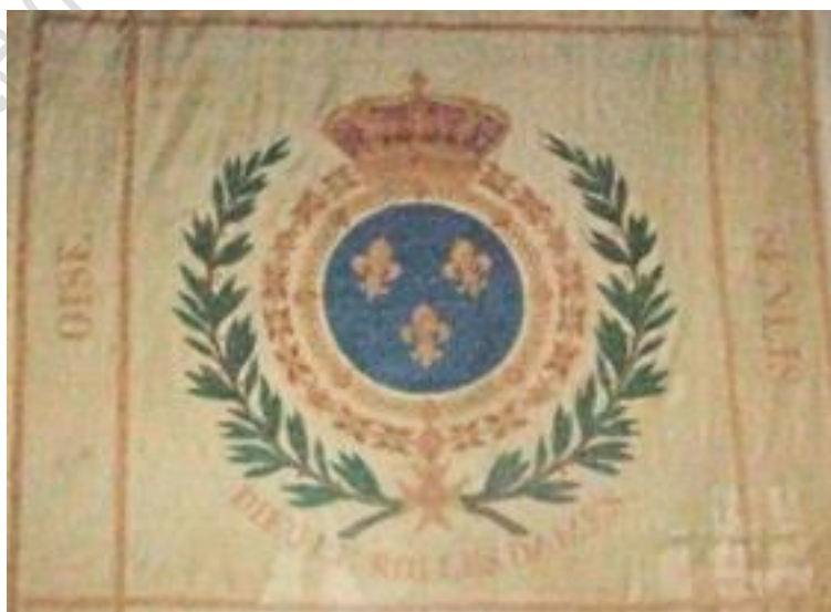
Partie centrale du drapeau exposé à la mairie

Quant à la devise du drapeau, il n'est pas impossible que la Garde nationale de la Restauration ait repris celle d'une formation militaire de l'Ancien Régime qui s'était brillamment illustrée. Cependant, la couleur adoptée fut le blanc quand autrefois la Compagnie de l'arquebuse de Senlis portait d'azur (bleu).