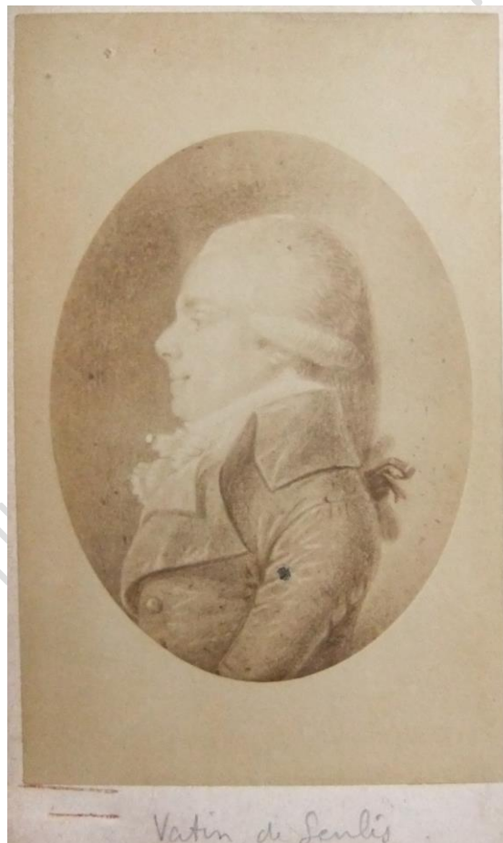
SHAS DD 258