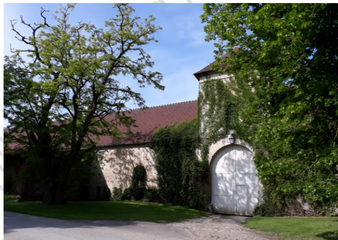
Ferme de La Borde

Réactivation par l'abbaye de Chaalis de la ferme de La Borde. Cette grange, issue du démembrement de la ferme de Fay (commune de Saintines, Oise) appartenant également au temporel de l'abbaye de Chaalis, est (re)bâtie entre 1315 et 1399 (Blary 1989, p. 218).