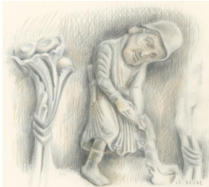
Mars ou avril, sculpture de Notre-Dame de Senlis vers 1151, crayons de couleur, 2018