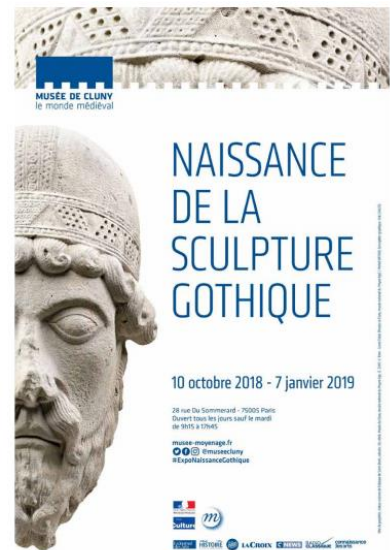
Photo mystère de septembre

À Paris, jusqu'au 7 janvier 2019, le musée de Cluny, musée national du Moyen Âge propose une exposition Naissance de la sculpture gothique. Saint-Denis, Paris, Chartres, 1135-1150 . L'exposition rassemble, de façon inédite, statues-colonnes déposées du portail royal de Chartres, vestiges de celles des portails occidentaux de l'abbé Suger à Saint-Denis, mais aussi d'autres témoignages d'un foisonnement d'expériences, portail Sainte-Anne de Notre-Dame de Paris, cloître de Saint-Denis ... Un art qui s'épanouira à Senlis.