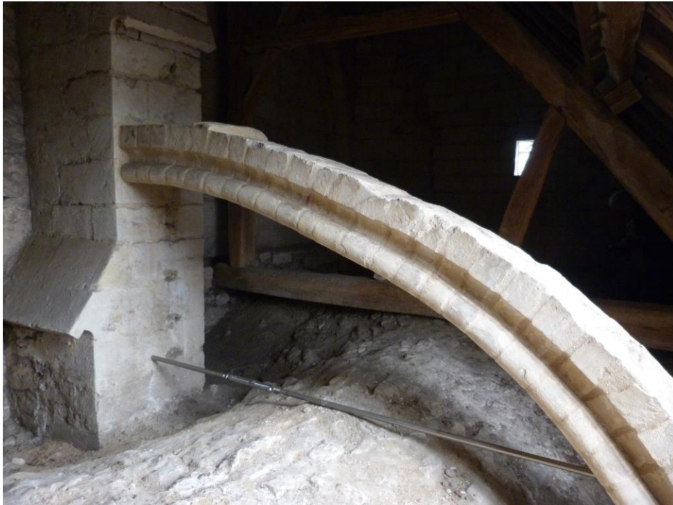
Arc-boutant dans les combles de la chapelle sud du chœur.

De nombreux sociétaires se sont ensuite rendus sur les lieux pour admirer le travail réalisé.