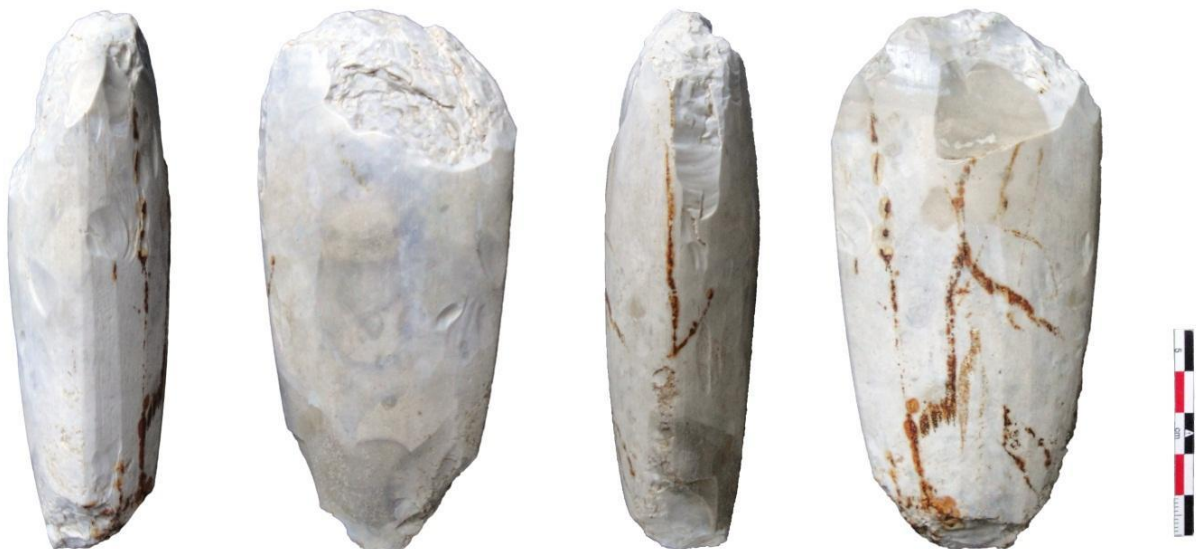
Hache polie d'Avilly