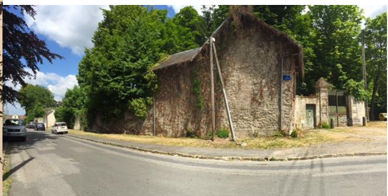
Texte et photos, Anne-Hortense Dorolle