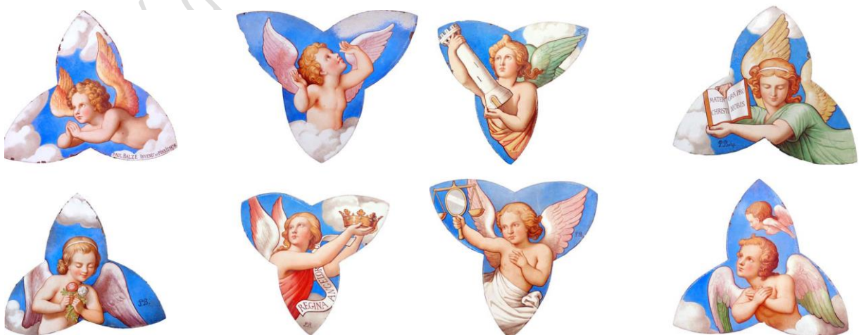
Texte et photos Jean-Marc Vasseur

Deux éléments émaillés sont présentés actuellement dans le vestibule du musée de l'abbaye royale de Chaalis. Une reconstitution iconographique permet de mieux apprécier l'ensemble décoré de la rosace occultée à son revers par la fresque du XVI e siècle.