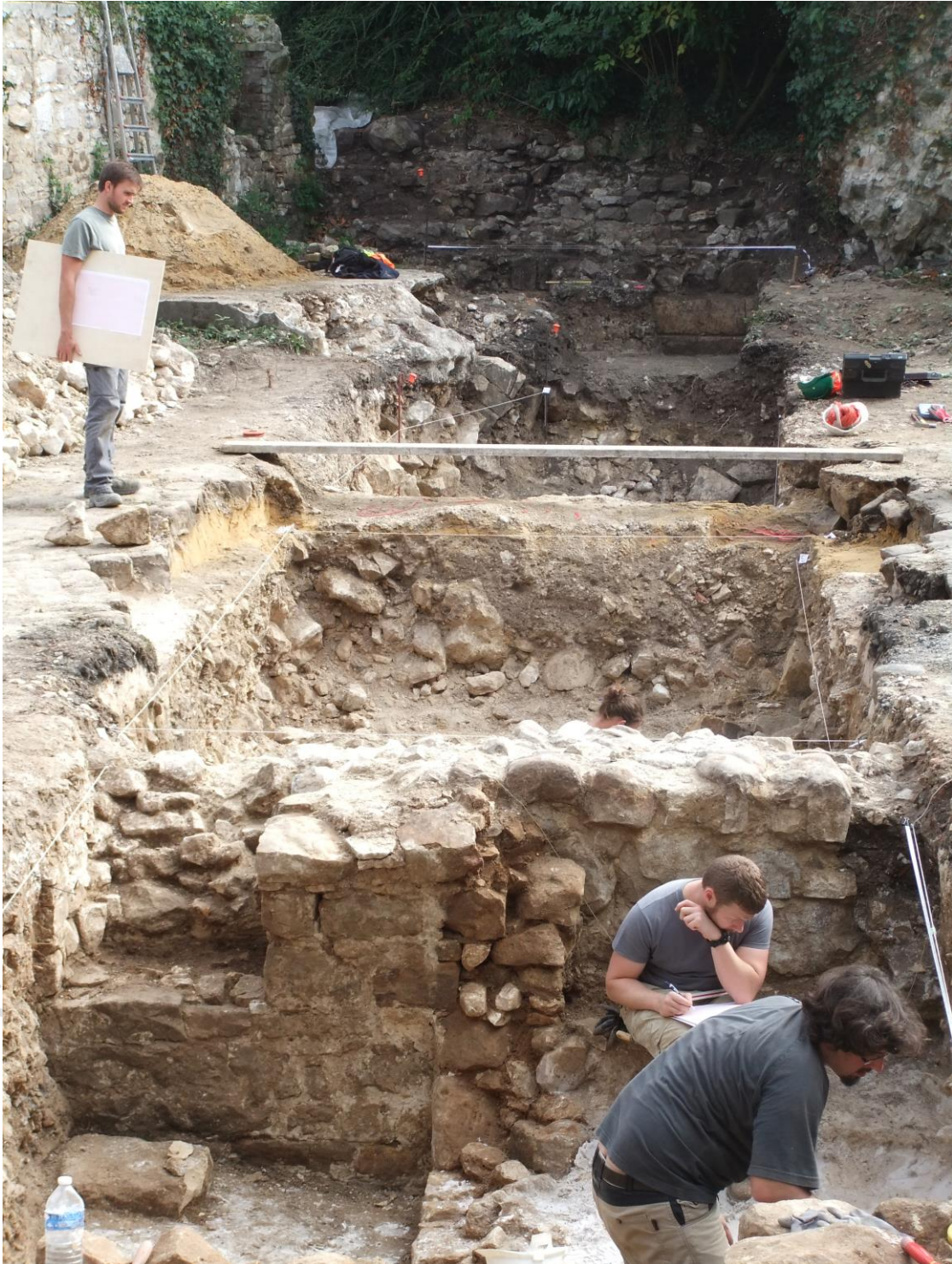
Perspective du sondage, la courtine au premier plan, l'assise du donjon à l'arrière plan