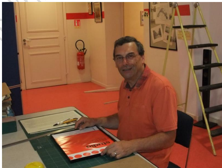
Montage de l'exposition Chronique d'une guerre annoncée