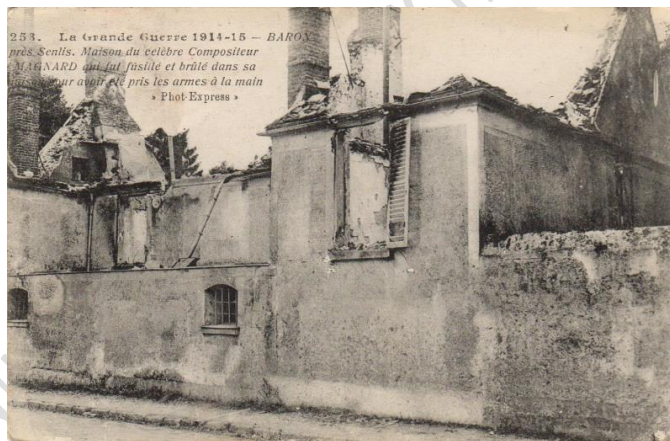
Maison d'Albéric Magnard incendiée par les Allemands

Pour célébrer le centenaire de la mort d'Albéric Magnard, une cérémonie officielle a dévoilé la plaque du collège éponyme de Senlis en présence de la petite fille du compositeur. Rappelons que Magnard reste le seul exemple de résistance civile armée locale à l'envahisseur allemand. Il est mort en défendant sa maison le 3 septembre 1914 au village de Baron, voisin de Senlis. Il avait fait l'objet d'une conférence de la SHAS par Marie-Laure Bodin en mars 2012.