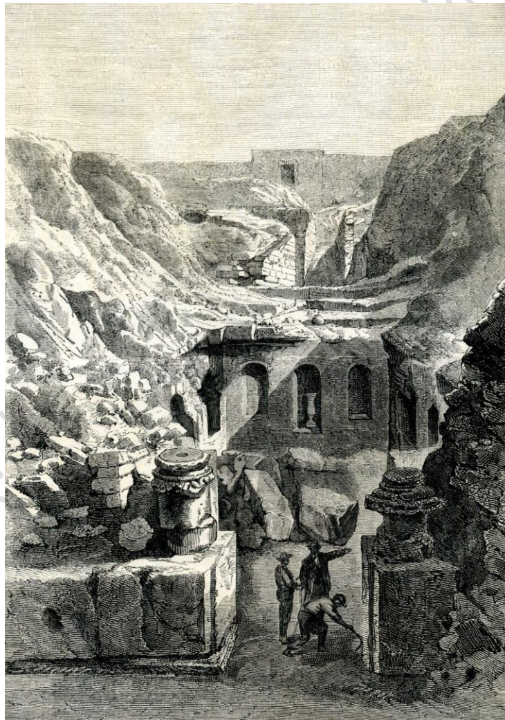
(Fouille des Arènes, Le Monde Illustré, 20 mai 1865,)