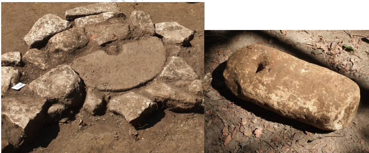
(Fragment de meule réemployé en dallage / Peson en pierre calcaire)

En juillet, comme l'année dernière, une nouvelle campagne d'exploration a eu lieu non loin du temple d'Halatte. Elle a permis de reconnaître un édifice rectangulaire composé d'une pièce accolée à la paroi nord et d'un couloir périphérique dallé pour partie de meules de réemploi. La crapaudine et le seuil de la porte de l'édifice repéré l'année passée ont été mis au jour.