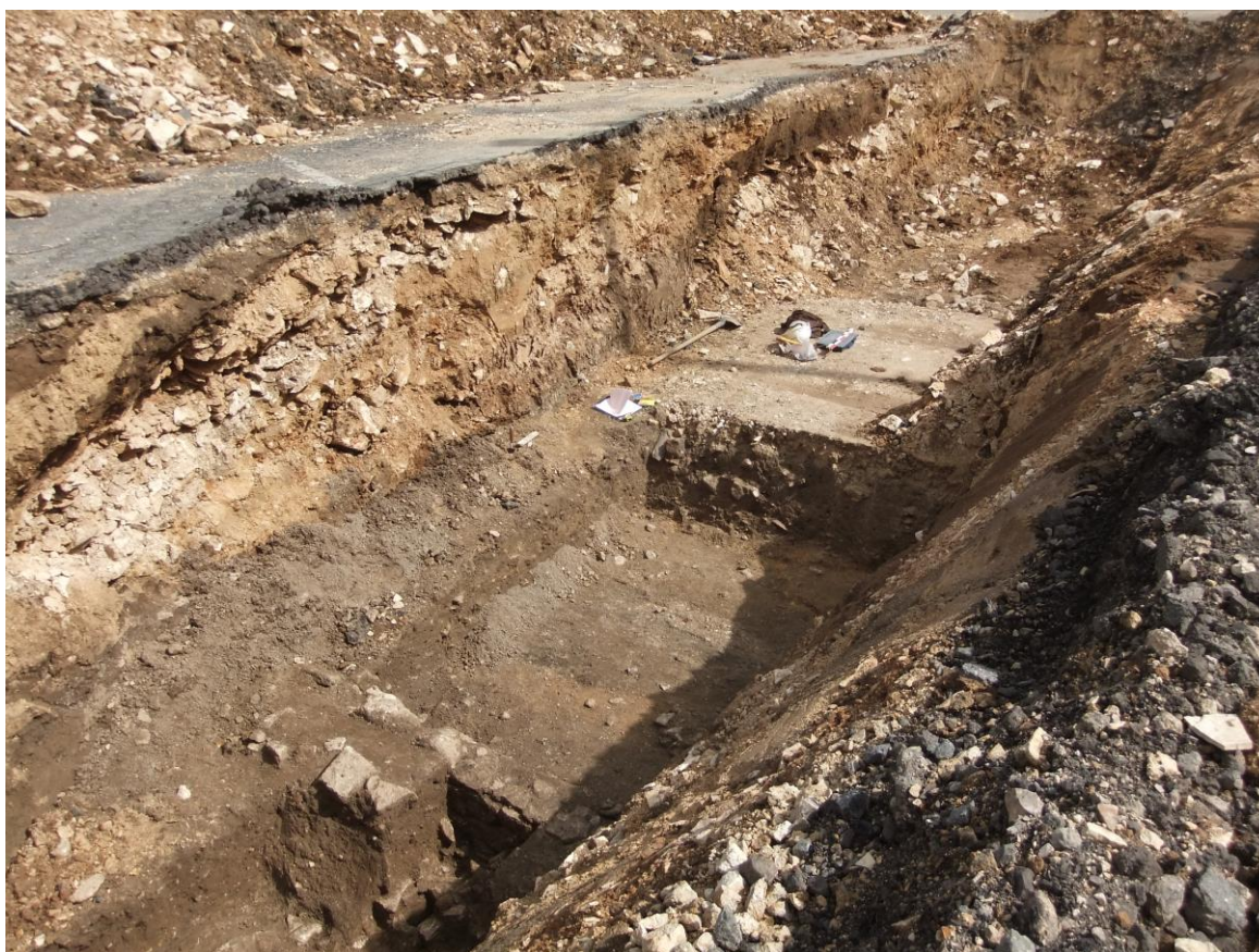
(De bas en haut : mur, voie antique, route XVII e siècle)

Un diagnostic archéologique préventif se déroule du 18 au 29 août à l'emplacement de l'ancienne cour de marchandises de la gare de Senlis, actuel parking de la gare et futur quartier neuf. Il a permis de repérer un tronçon de voie antique (chaussée Brunehaut) doublé d'une route du XVII e siècle.