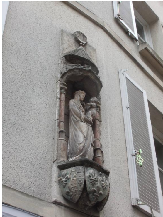
@ Gilles Bodin