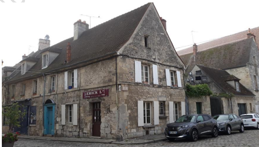
Maison canoniale, prison et grenier du chapitre © Gilles Bodin.

Le conférencier localise les différentes maisons et explique les modifications de voirie subies par le quartier, en particulier la place Notre-Dame régulièrement agrandie au cours du temps.