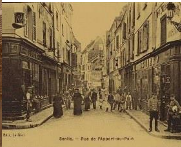
Senlis (base Séraphine)