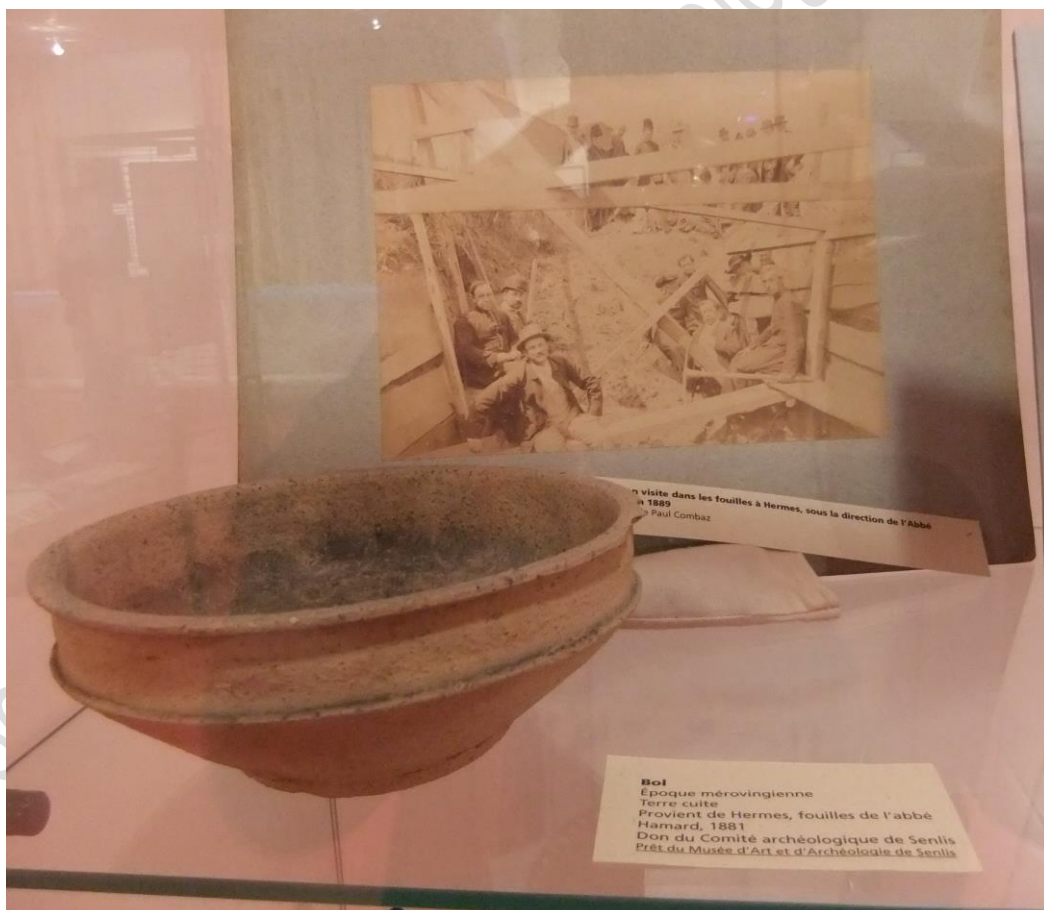
Vitrine Hamard, exposition « Trésors de la S.H.A.S. » décembre 2012

L'abbé Hamard prit sa retraite à Chanu dans l'Orne en 1906 où il décéda en 1923. Ses collections furent dispersées. Le Comité Archéologique de Senlis acheta une centaine d'objets dont quelques-uns sont identifiés aujourd'hui au Musée d'art et d'Archéologie. La villa-Musée fut endommagée en 1940 et laissée sans entretien. Ses ruines ont été arasées il y a peu d'années.