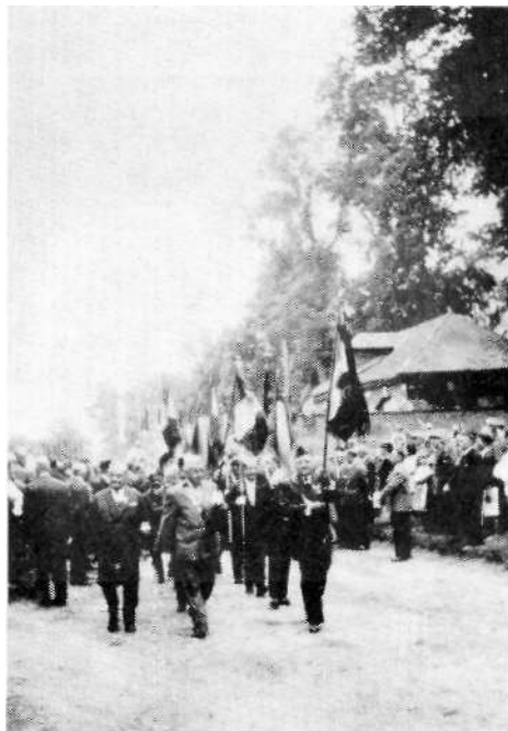
Les Anciens quittent la «Place du 3 e Houzards » pour se rendre à l'Hôtel-de-Ville.